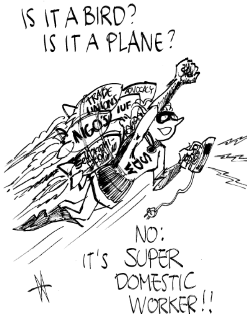
Est-ce un oiseau ? Est-ce un avion ? Non : C'est une travailleuse domestique superbe !!!

L'année pilote sera également consacrée à développer la prise de décisions démocratique au sein du réseau, afin que les plans dans les prochaines années puissent être discutés et approuvés avec la participation, en particulier, des organisations propres des travailleuses domestiques/employées de maison.